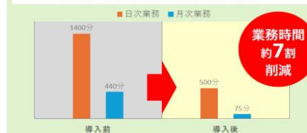
【実例】お弁当に関する業務時間の推移